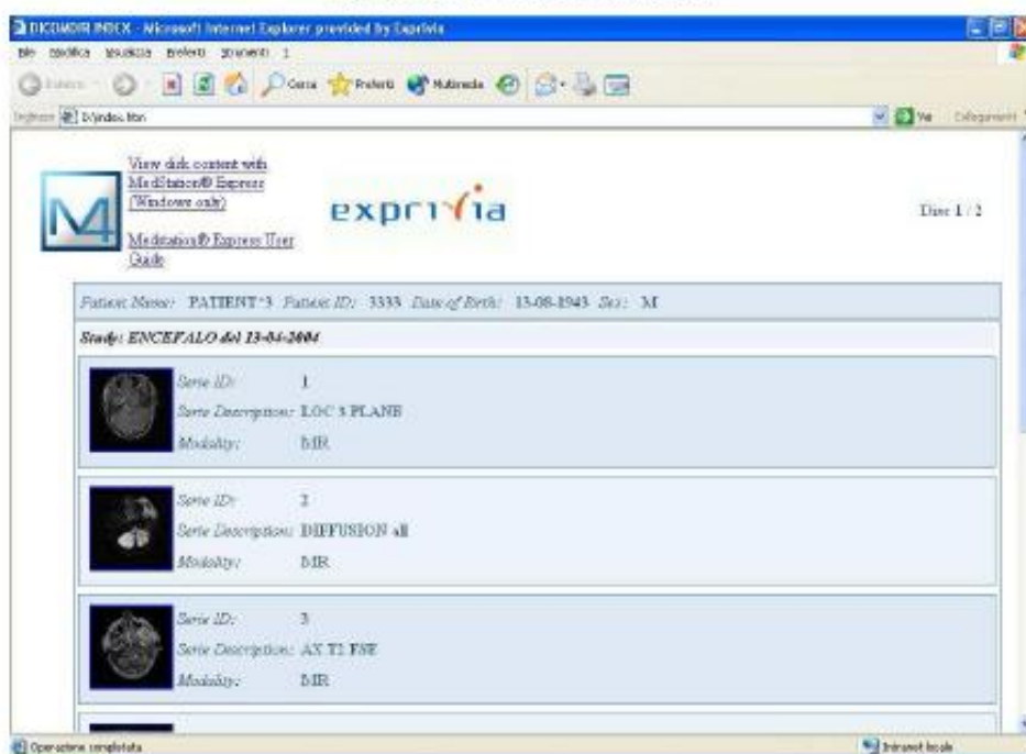
Figura 1. Visualizzazione del contenuto web

Nota: Se il sistema non supporta l'avvio automatico del programma, accedere alle "Risorse del Computer", individuare e selezionare la lettera assegnata al CD-ROM, premere il tasto destro del mouse e fare click sulla voce "AutoPlay". Se la voce "AutoPlay" non è presente, aprire la cartella e fare doppio click sulla voce "index.htm".